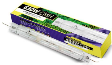
Lumatek CMH Lamp 630W DE 4K